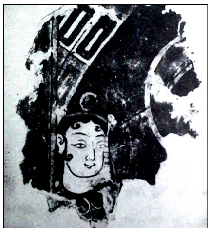
۲-بخشی از یک دیواره نگاره مانوی

چنانچه [ من نقاشی کردم ] مال خود را (ویدن گرن ، ۱۳۷۶: ۱۳۷)