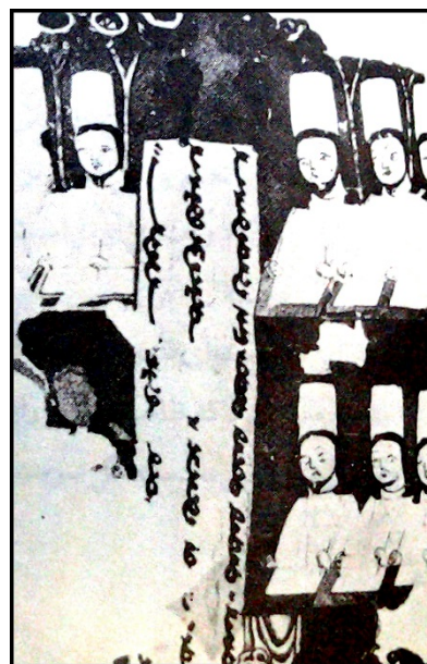
۴- خوشنویسان مانوی (نگاره مینیاتوری)