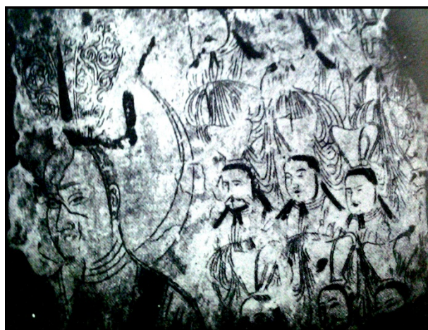
۱-قطعه ای از یک طومار-کتاب مصور