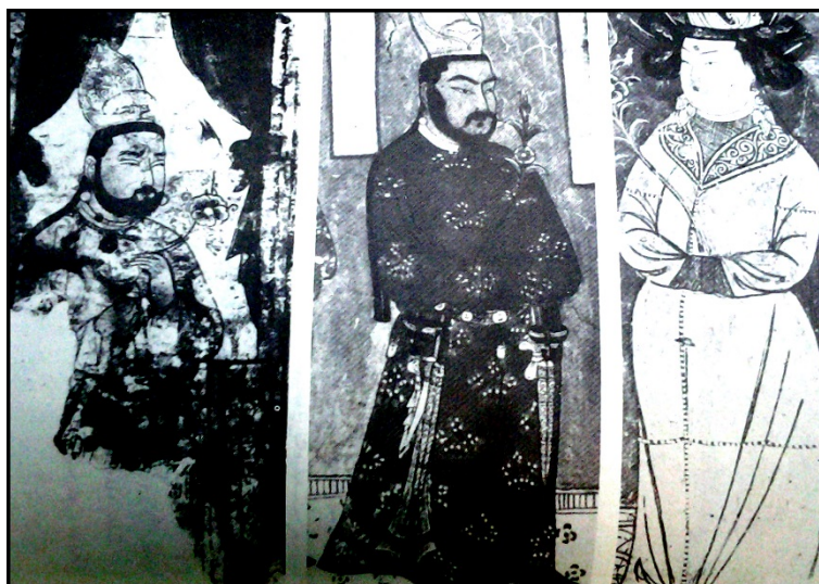
۶-چهره هبه کننده : شاهزاده اویغوری

روشن ، قرمزوسبز. (اسماعیل پور ، ۱۳۹۱: ۵) آنها(کاتبان ) برای رفع یکنواختی سطرهایی که با مرکب مشکلی نوشته می شده اند بسیارراغب بودند که با آوردن چندسطر رنگی بیشتر به رنگ سرخ ارغوانی آن را دل انگیز ترکنند ظاهرا مانویان فن چاپ راورد می کردند زیرا برای هنرخوشنویسی اهمیت بسیار قابل بودند. سنت خوشنویسی به ویژه دردیرهای مانوی ارجمند شمرده می شد این را می توان درنگارش ویژه نامه ها ، ترتیب جذاب ستونها ونظم دقیق ظاهرحروف مشاهده کرد.(کلیم کایت، ۱۳۷۳:۶۶) نوشته ها معمولا به رنگ سیاه ویامرکب هندی که از لحاظ مقاومت در برابر رطوبت وآب برای قرنهای شناخته شده بود نوشته می شد. ترتیب متون نیز درنهایت دقت انجام می گرفت یک صفحه کتاب یاتمامی سطح آن ازنوشته پوشیده می شد یابه دوستون نوشته ویابیشترتقسیم بندی می گردید. عنوانها محتملا درشت ورنگی ودرطرف رساله که ازآن بحث می رفت گذاشته می شد. گلها وترئیناتی که اطراف آن رامی گرفت ازهمان رنگ نوشته بود امانقطه گذاریها بارنگهای متضاد وبه صورت خطوط کوتاه ونقطه انجام می گرفت.(ویدن گرن ، ۱۳۷۶:۱۴۲) همانگونه که ذکرگردید برای اجتناب ازیکنواختی ، معمولا خطوطی بارنگی دیگر که اغلب نارنجی بود بین دو خط معمولی سیاه رنگ عرضه می گردید. جلد کتابها نیز بنابر الگوی اروپایی غالباً امرذیقیمی بود. گوشه های جلد اغلب درعاج یاچرم لعاب داده یاپوست گوساله پوشیده می شد. جلدعبارت بود ازصفحه مقوایی که بایک ورقه ضخیم طلا قاب شده وبا صدف لاک پشت تزیین یافته بود.(همان: ۱۴۳)